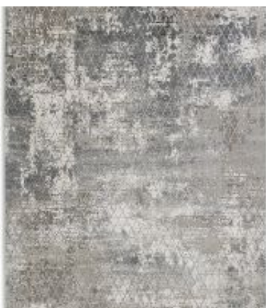
Vision - Raute Anthrazit | 212 040