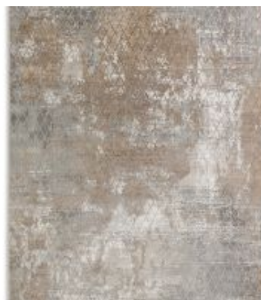
Vision - Raute Beige | 212 006