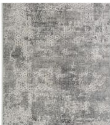
Vision - Dreieck Anthrazit | 213 040