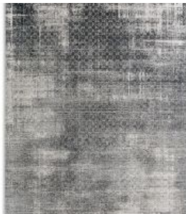
Vision - Blümchen Anthrazit | 211 040