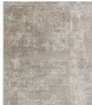
Vision - Dreieck Beige | 213 006