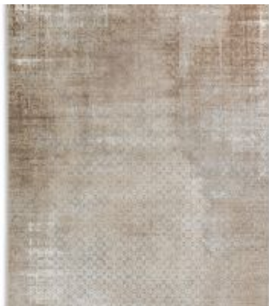
Vision - Blümchen Beige | 211 006