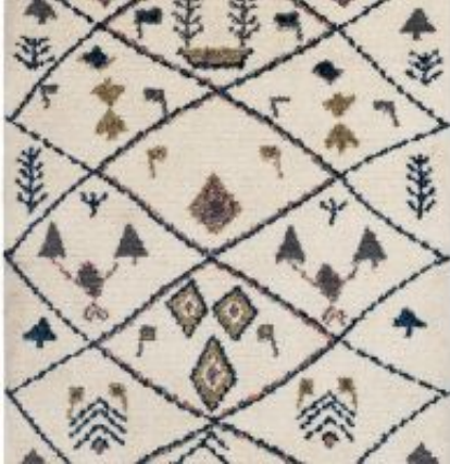
Urban - creme | 181 001