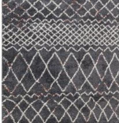
Urban - grau | 182 040