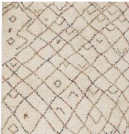
Urban - creme | 184 001