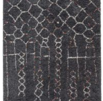
Urban - grau | 183 040