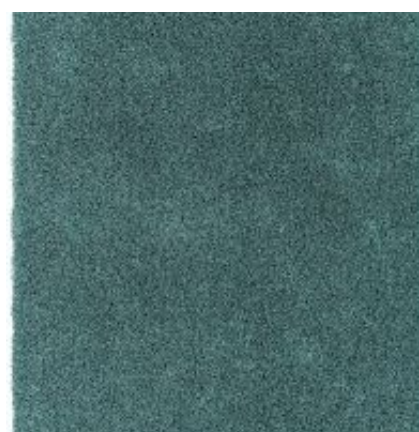
New Feeling - mint | 037