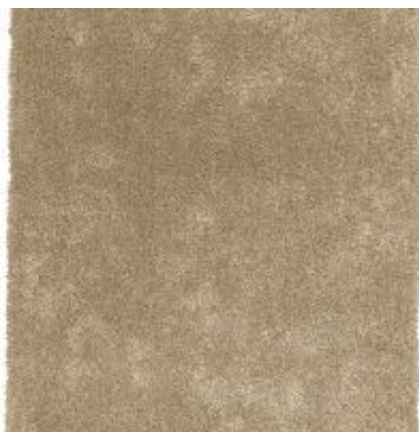
New Feeling - creme | 000