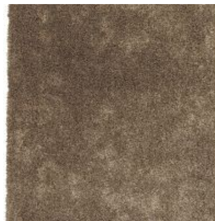
New Feeling - beige | 006