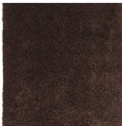
New Feeling - toffee | 064