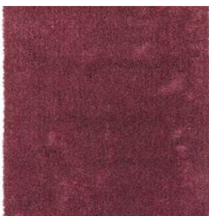
New Feeling - rosa | 011