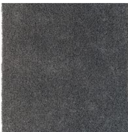
New Feeling - anthrazit | 040