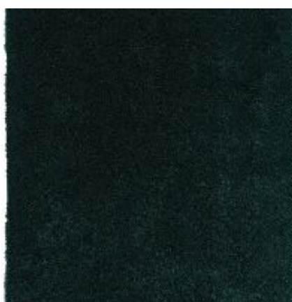
New feeling - dunkelgrün | 034