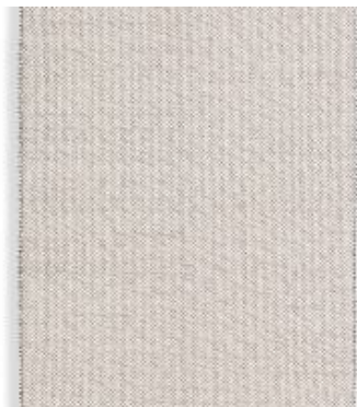
Miro - natur | 191 007