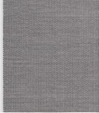
Luna - anthrazit | 191 040