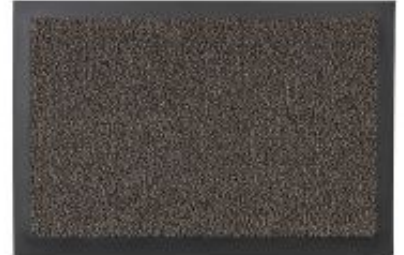
Turmalin - braun | 060