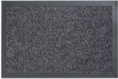
Turmalin - blau | 020