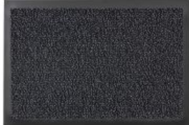
Turmalin - anthrazit | 040