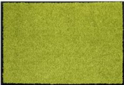
Proper Tex Uni - grün | 030