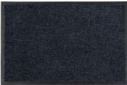
Proper Tex Uni - schwarz | 044