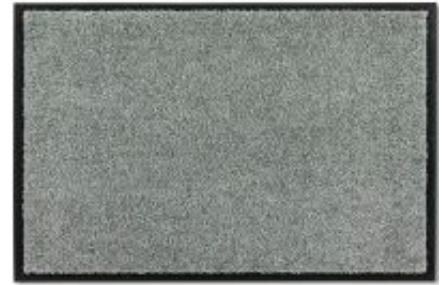
Proper Tex Uni - mint | 022