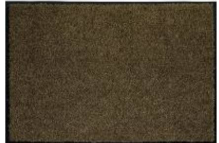
Proper Tex Uni - anthrazit-braun | 042