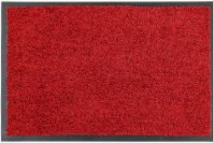
Proper Tex Uni - rot | 011