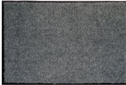
Proper Tex Uni - grau | 040