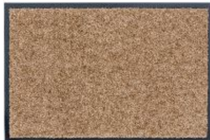
Proper Tex Uni - sand | 006