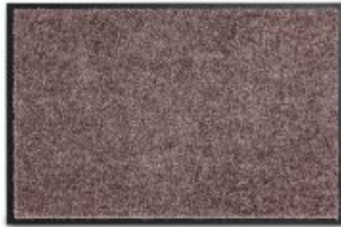
Proper Tex Uni - blush | 017