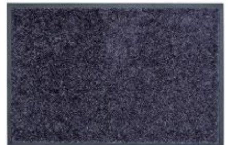
Proper Tex Uni - blaugrau | 041