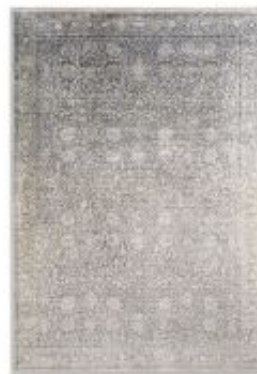
Scala - Orient grau | 223 005