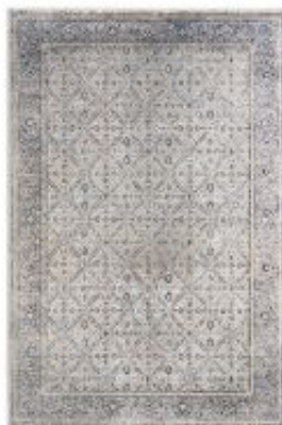
Scala - Bordüre blau | 222 020