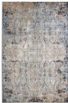
Scala - Allover bunt | 221 099