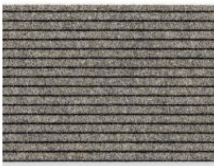
Rip Line Tandem - beige | 006