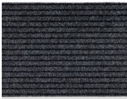
Rip Line Tandem - anthrazit | 048