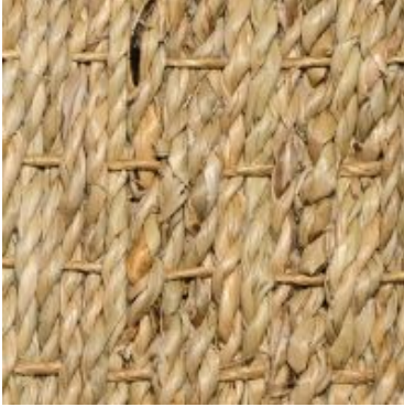
Rangoon - natur | 001