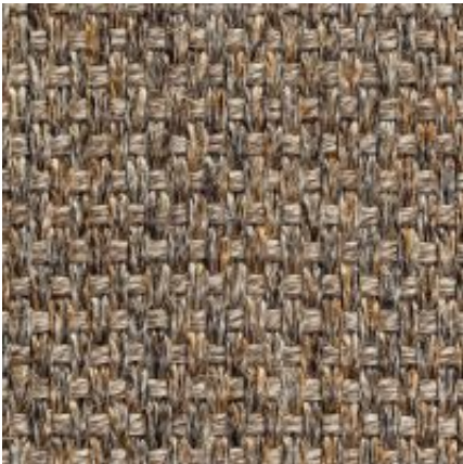
Quito - nuss | 084