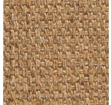
Quito - sand | 081