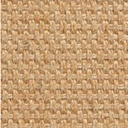
Quito - chablis | 007