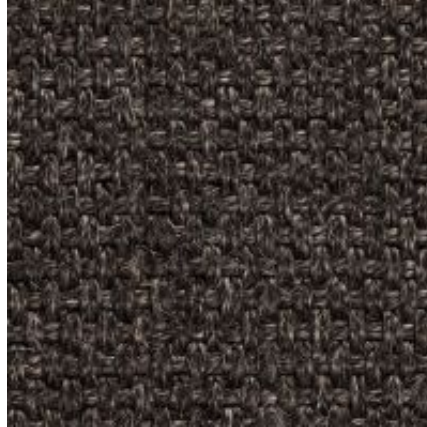
Quito - anthrazit | 044