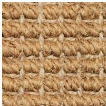
Mangalore - natur | 001