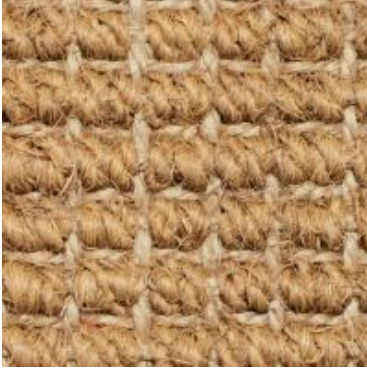
Mangalore - natur | 001