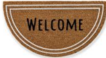
Coco Design - Welcome | 040