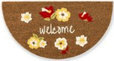
Coco Design halbrund - Blumen Welcome | 039