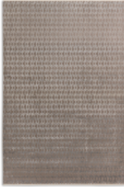
Chains - grau | 005