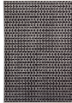
chains - silber | 004