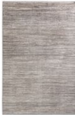
Gravina - Streifen Silber | 225 004