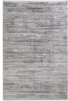
Gravina - Streifen Anthrazit | 225 040