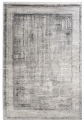
Gravina Kreise beige | 232 020