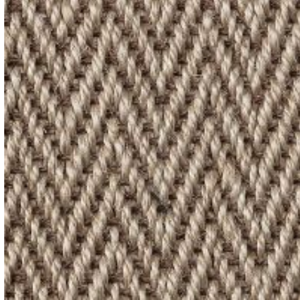
Campinas - bast | 062