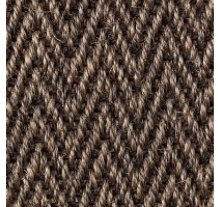
Campinas - mandel | 088