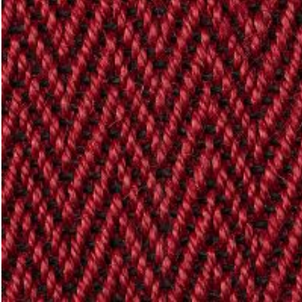
Campinas - rot | 010