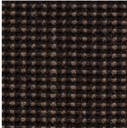
Baruta - ebenholz | 044