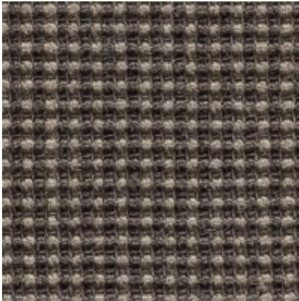
Baruta - stein | 041