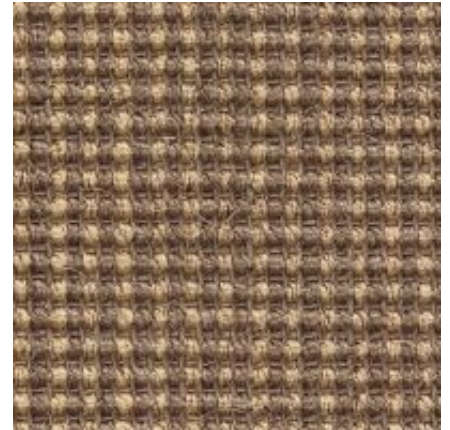
Baruta - camel | 060