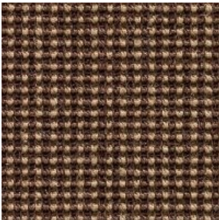
Baruta - kaffee | 066