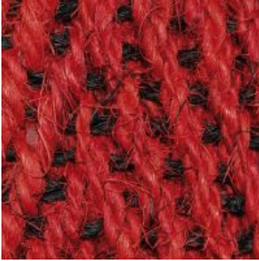
Bangalore-Laeufer - rot- schwarz | 2230