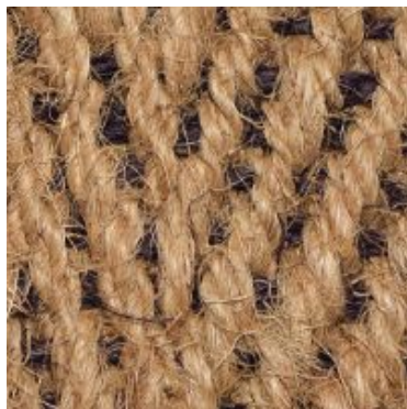
Bangalore-Laeufer - natur- braun | 2210