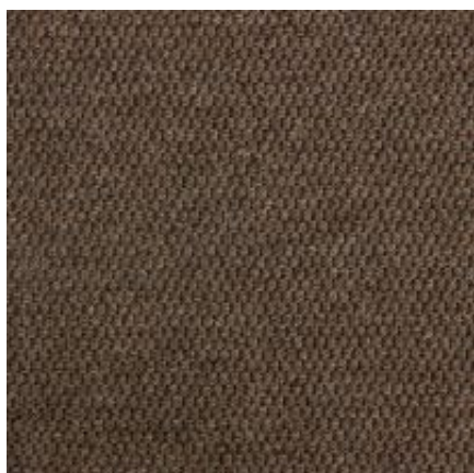
Baltimore - mocca | 060