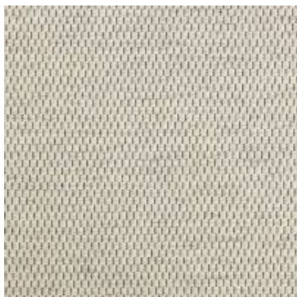
Baltimore - elfenbein | 001