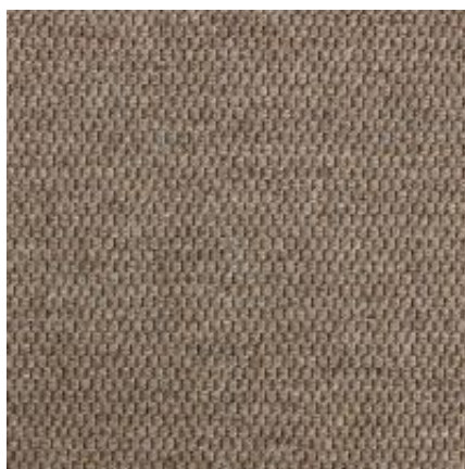
Baltimore - caramel | 061