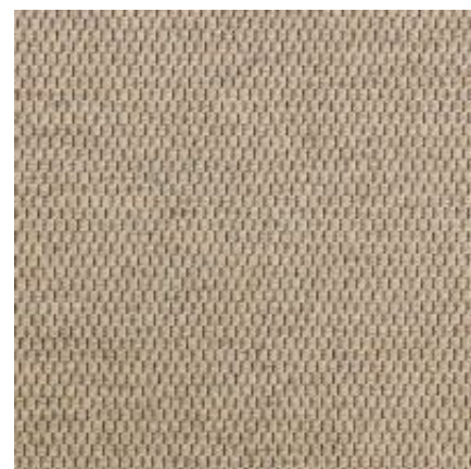
Baltimore - chamois | 002