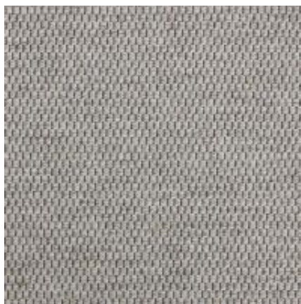
Baltimore - silber | 040