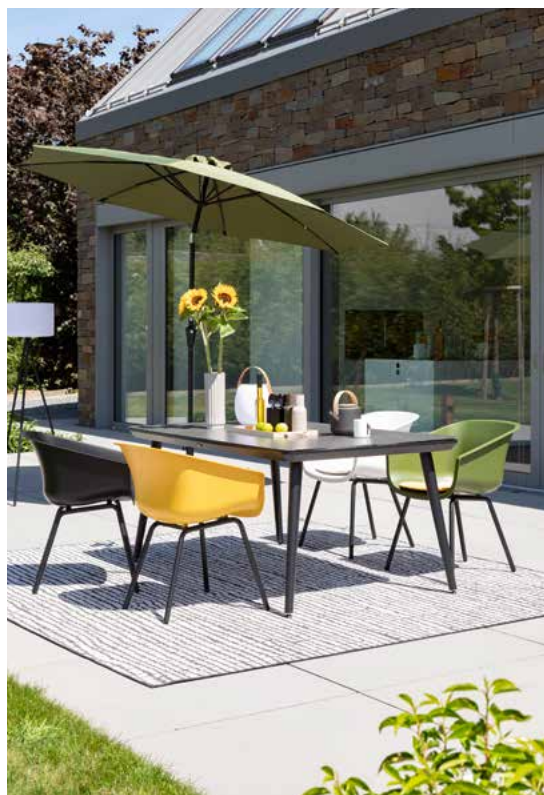
Parkland. Schöner Wohnen-Kollektion.