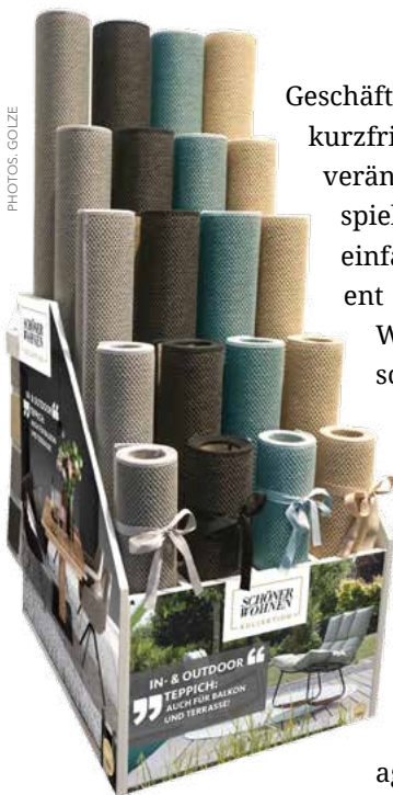
Parkland. Schöner Wohnen-Kollektion. Golze

Geschäft und wollen unsere Ware immer kurzfristig verfügbar halten. Für die sich verändernden Logistik-Prozesse wie beispielsweise das Dropshipping braucht es einfach mehr Fläche, um möglichst effizient arbeiten zu können. Wir verbessern Warenannahme und Warenausgang, schaffen Raum für die Qualitätsprüfung und installieren zusätzliche Packstraßen. Die Pakete werden ja auch schwerer und mit einer Automatisierung läuft alles einfacher und schneller. Es wird außerdem drei weitere Laderampen geben. Wir bauen an, bevor wir aus allen Nähten platzen.“ Carsten Gähle fügt hinzu: „Agieren statt reagieren ist unser Motto. So begleitet uns beispielsweise schon seit langem das Lieferkettenschutzgesetz bei allen Prozessen.“ Bereits jetzt ist laut Ekkehart Golze ein Großteil der Lieferanten zertifiziert, „darauf haben wir schon vor Jahren geachtet. Im Gegenzug haben