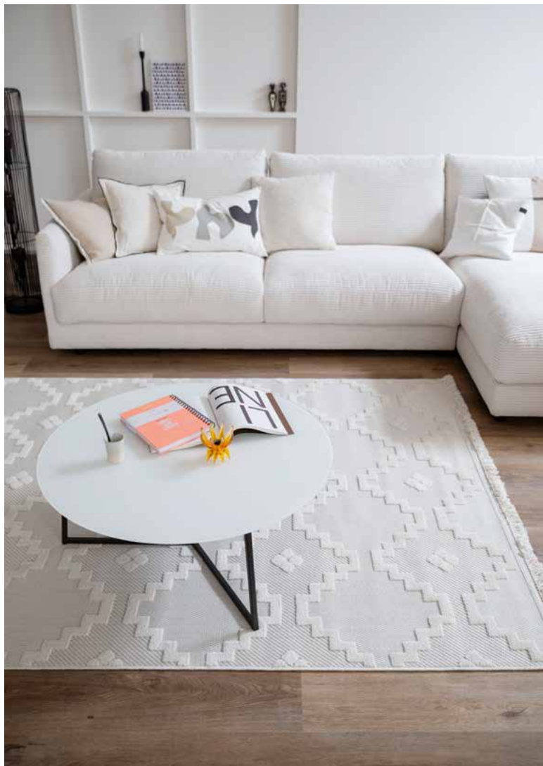
Summer. Schöner Wohnen-Kollektion. Golze

Eine der Stärken von Golze ist der Wunschmaß-Service, der vor rund zehn Jahren ein-