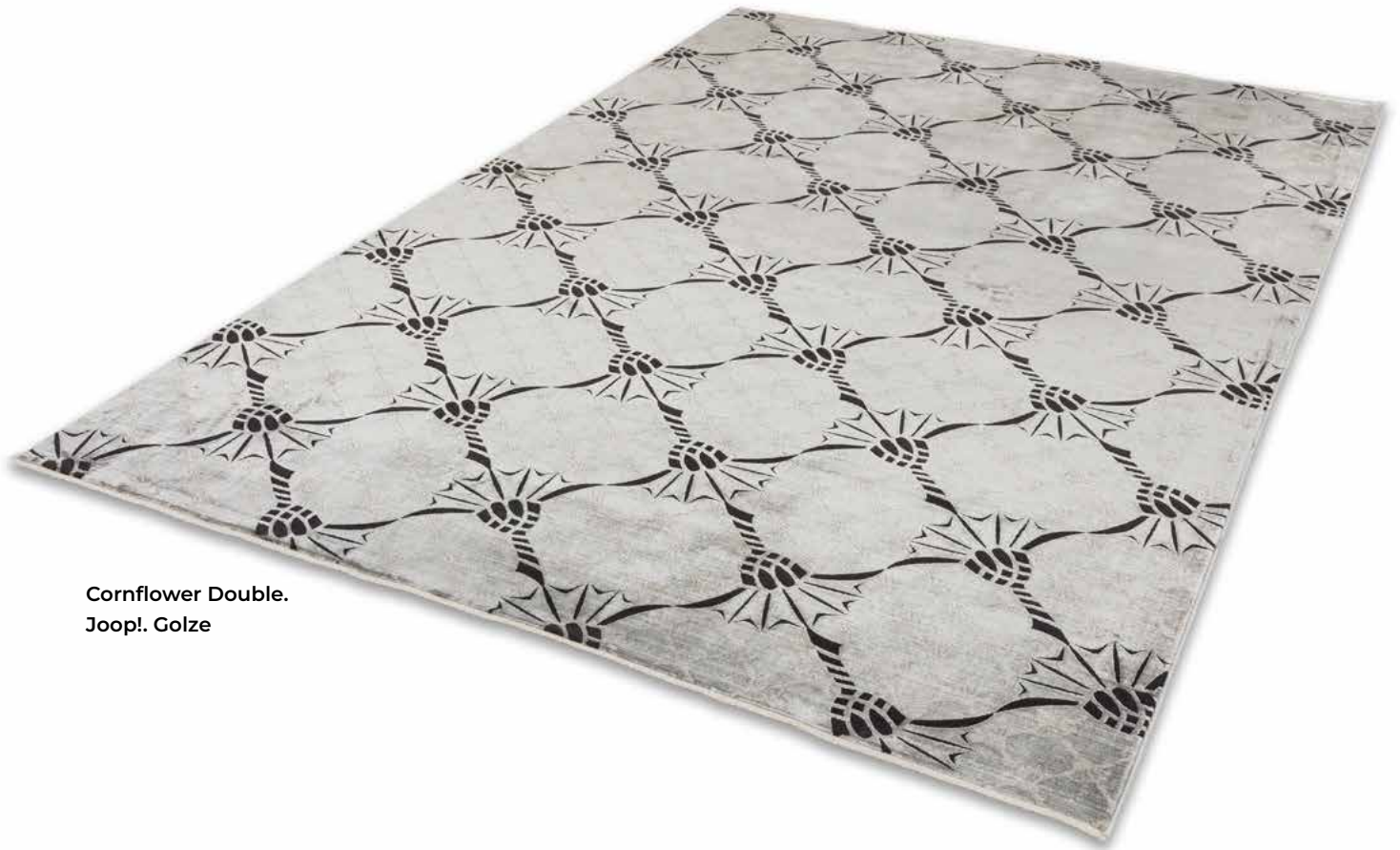
Cornflower Double. Joop!. Golze